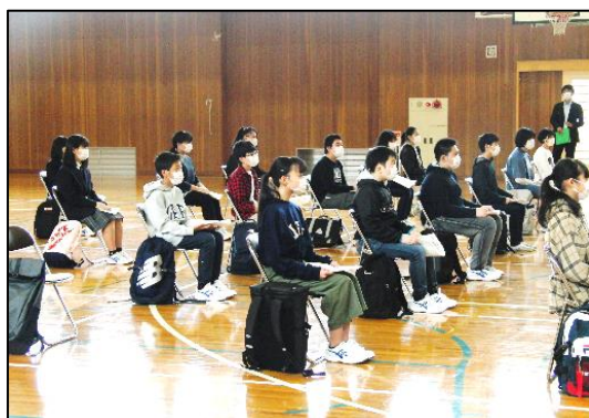
▲ 間隔を空けて感染症予防の説明を聞く生徒たち 新学期からは、学校でも着席や整列時の間隔に気をつけて諸活動を行います。