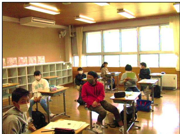
▲ 登校日 教室に全員がそろいました。

学校再開まであと少し。生徒たちには、学習の習慣を含めて（学校ではWebページでも学習支援の情報を掲載しています）生活のリズムを整え、新学期からの学校生活を元気に送ってほしいと思います。